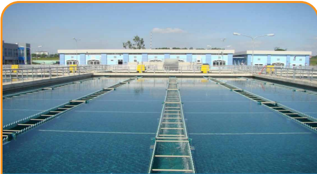
CUNG CẤP GIẢI PHÁP VÀ THI CÔNG HỆ THỐNG XỬ LÝ NƯỚC CẤP