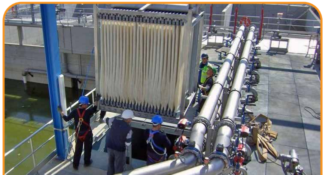
CUNG CẤP MÀNG LỌC MBR VÀ CÁC GIẢI PHÁP LIÊN QUAN