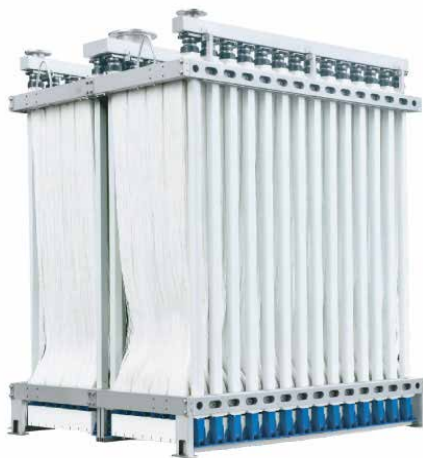
HÌNH ẢNH SẢN PHẨM