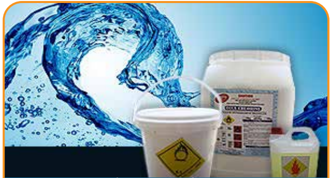
CUNG CẤP HÓA CHẤT XỬ LÝ NƯỚC VÀ HÓA CHẤT CÔNG NGHIỆP