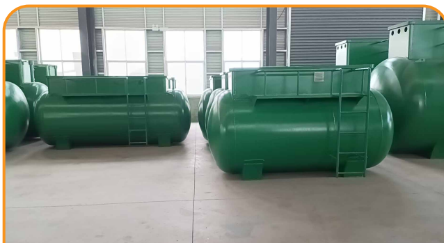
CUNG CẤP MODULE HỆ THỐNG XỬ LÝ NƯỚC THẢI MBR