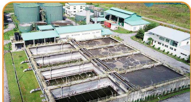
THIẾT KẾ GIẢI PHÁP CÔNG NGHỆ THI CÔNG HỆ THỐNG XỬ LÝ NƯỚC THẢI CHĂN NUÔI