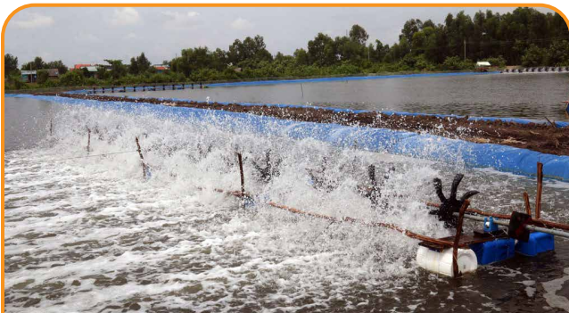
CUNG CẤP GIẢI PHÁP CẢI TẠO MÔI TRƯỜNG NƯỚC NUÔI TRỒNG THỦY HẢI SẢN