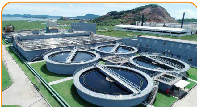
THIẾT KẾ GIẢI PHÁP CÔNG NGHỆ THI CÔNG HỆ THỐNG XỬ LÝ NƯỚC THẢI CÔNG NGHIỆP