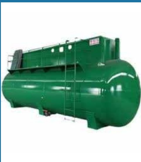
HÌNH ẢNH SẢN PHẨM